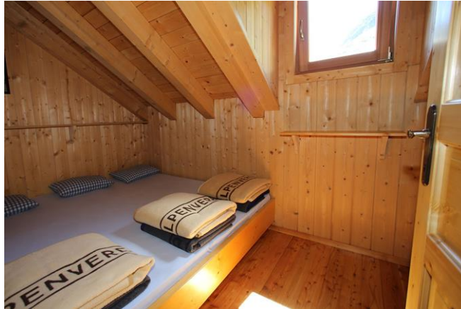
Fotka pro představu matraz lageru. Chaty jsou čisté a moc pěkné

První den budeme ubytováni na chatě Ignatz Mattise Hütte . Cena ubytování je cca 35Eur se snídaní, večeri si vybíráte z jídelníčku. Spaní je zajištěno ve společné ložnici, kam potřebujete pouze vložku do spacáku (Například zde ). Další den pokračujeme na chatu Keinprecht Hütte . Cena ubytování cca 40€ se snídaní.