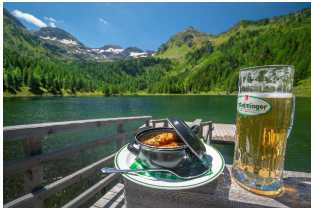
Duisitzkarsee a místní dobroty

Snídaní vždy budeme mít na chatě, v průběhu soboty dojdeme k chatě Duisitzkarsee Hütte, kde si můžete dát polévku s výhledem na krásné jezero. Další den je nutné mít jídlo vlastní. Osobně si vždy nosíme krájený chleba, tvrdý sýr nebo suchý salám a nějakou tu sušenku. Večere jsou pak na chatě. Pro představu tradiční rakouská polévka s knedlíkem stojí 7,10€.